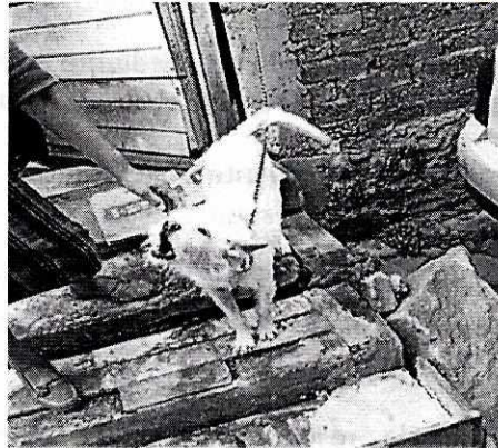
Fotografías que muestran al ejemplar canino de la denuncia.

Por lo antes expuesto esta Subprocuraduría Ambiental, de Protección y Bienestar a los Animales para el caso que nos ocupa, se procede a dar por concluida la investigación de la denuncia ciudadana bajo el número de expediente citado al rubro, con fundamento en el artículo 27 fracción III de la Ley Orgánica de la Procuraduría Ambiental y del Ordenamiento Territorial.