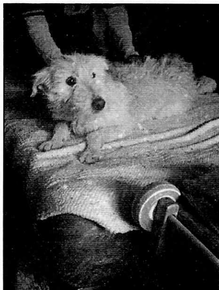
En la imagen se observa al canino de nombre "Nala".