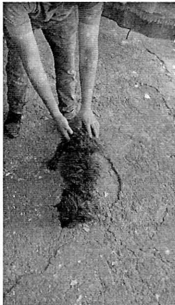
En la imagen se observa al canino de nombre "Lula".

PROCURADURÍA AMBIENTAL Y DEL ORDENAMIENTO TERRITORIAL DE LA CIUDAD DE MÉXICO SUBPROCURADURÍA AMBIENTAL, DE PROTECCIÓN Y BIENESTAR A LOS ANIMALES