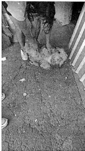
En la imagen se observa al canino de nombre "Poli".