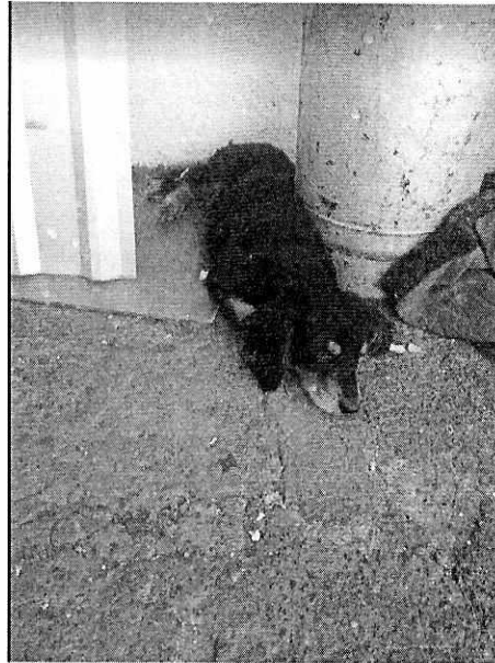
En la imagen se observa al canino de nombre "Chiki".

PROCURADURÍA AMBIENTAL Y DEL ORDENAMIENTO TERRITORIAL DE LA CIUDAD DE MÉXICO SUBPROCURADURÍA AMBIENTAL, DE PROTECCIÓN Y BIENESTAR A LOS ANIMALES