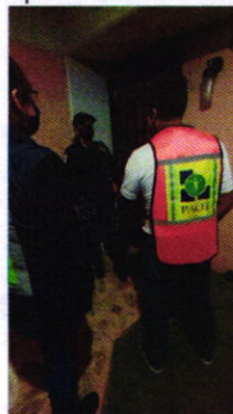
Fotografía 5. Visita de Reconocimiento de hechos en conjunto con BVA.

En virtud de la señalado con antelación, se realizó en acompañamiento de personal de la Brigada de Vigilancia Animal adscrita a la Secretaría de Seguridad Ciudadana de la Ciudad de México (BVA), una tercera visita de reconocimiento de hechos, realizándose en un horario nocturno, durante la cual se trató de establecer comunicación con el responsable de los caninos; no obstante pese a la insistencia de ambas autoridades, no fue posible establecer comunicación, toda vez que nadie abrió la puerta de la vivienda.