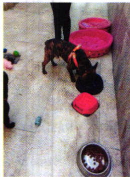
Fotografía 8. Nuevo sitio de alojamiento.