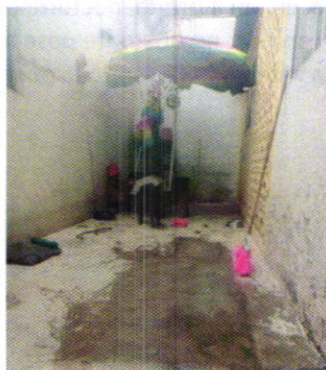
Fotografías 3. Cumplimiento de las recomendaciones.

En seguimiento al presente caso la persona responsable de los caninos remitió evidencia del cumplimiento de las recomendaciones realizadas en la visita de reconocimiento de hechos antes señalada.