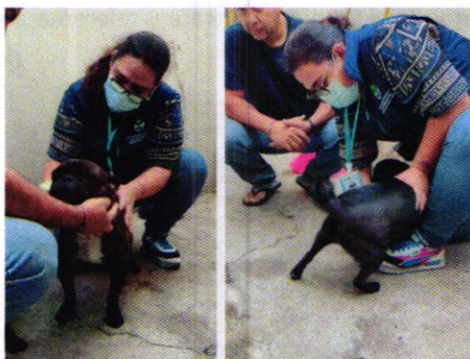
Fotografías 1 y 2. Evaluación física de los ejemplares "Lilo" y "Stich".

Aunado a lo anterior, durante la diligencia antes citada, se cuestionó al responsable de los caninos respecto a los hechos que señalan que los perros "Lilo" y "Stich" son atados con cables; al respecto dicha persona señaló que sus perros se enredaban en esos cables y que él solo los liberaba, pero a fin de evitar que se presentara esa situación nuevamente, mandó retirar los cables que colgaban en el patio. Cabe señalar que durante la visita se permitió la entrada al patio en el cual no se constató la existencia de cables que colgaran.