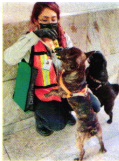
Fotografía 7. Evaluación etológica a los ejemplares caninos motivo de denuncia, de nombres "Lilo" y "Stich".

Posteriormente personal de esta Subprocuraduría realizó una visita de reconocimiento de hechos en el nuevo domicilio de los caninos "Lilo" y "Stich", el cual será su hogar permanente, realizando la evaluación de los mismos y durante la cual se constató que cuentan con las condiciones de bienestar animal en cuanto a condición corporal y muscular, alojamiento, alimento y agua brindada, comportamiento y condición de salud.