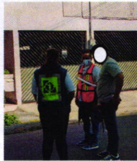
Fotografías 4. Segunda Visita de Reconocimiento de hechos.

Por la antes analizado y en seguimiento a la denuncia, se realizó una segunda visita de reconocimiento de hechos por personal adscrito a esta Procuraduría; en la cual se estableció comunicación con la persona responsable de los ejemplares caninos; la cual no permitió el ingreso a su inmueble para una segunda evaluación, señalando que sus perros no sufren de maltrato y referente a los videos antes señalados, señaló que se trató de una situación atípica.