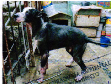
Figuras 1, 2 y 3. Ejemplares denunciados.