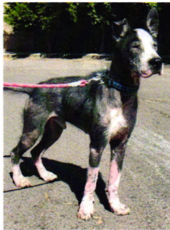
Figura 4. Evidencia del bienestar proporcionado por la persona adoptante.

Derivado de lo observado por personal de esta Entidad, la persona responsable de los ejemplares, los entregó de manera voluntaria al personal de esta Subprocuraduría, a efecto de que le sean brindados los cuidados de bienestar necesarios. Por lo cual la PAOT hizo entrega de los ejemplares a su persona adoptante, quien se comprometió a proporcionar las condiciones adecuadas de bienestar.