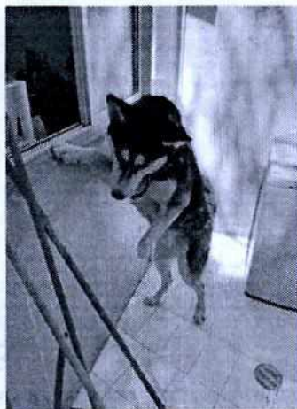
Fotografía. Vista de los caninos evaluados