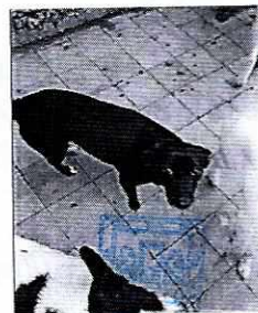
Fotografías que muestran a los ejemplares caninos motivo de la denuncia.