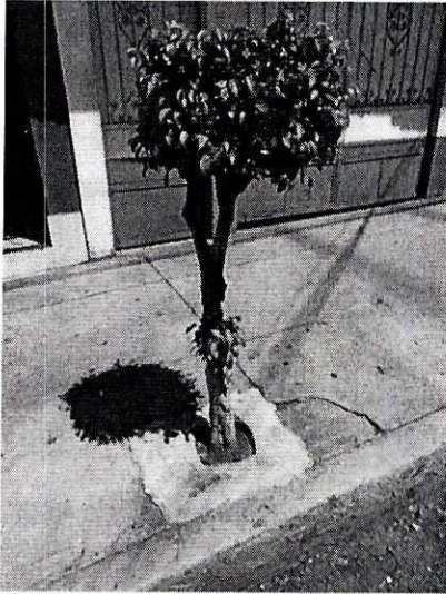
Fotografía que muestra al individuo arbóreo motivo de la denuncia.

En virtud de lo anterior, se le informó sobre la normatividad vigente en materia y con fundamento en los artículos 5 fracción XIX y 15 bis 4 fracción X de la Ley Orgánica de la Procuraduría Ambiental y del Ordenamiento Territorial de la Ciudad de México, se comprometió, en apegarse a la normatividad establecida en materia de poda y derribo de arbolado referida, con la finalidad de evitar futuras intervenciones al arbolado motivo de la denuncia o en de cualquiera que se encuentre ubicado en el interior del territorio conformado por la Ciudad de México.