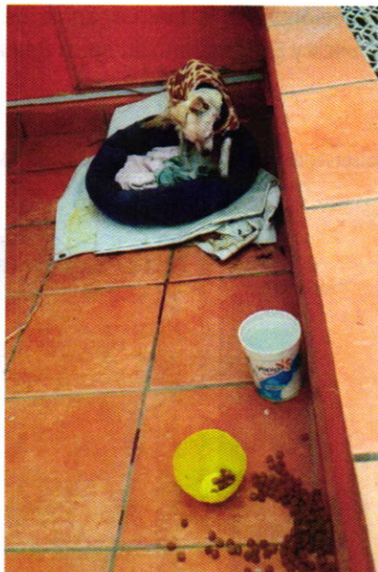
Figura 4. Evidencia del bienestar proporcionado por la persona adoptante.

En virtud de lo antes expuesto, esta Entidad considera procedente emitir la presente resolución, de conformidad con el artículo 27 fracción VII de la Ley Orgánica de esta Procuraduría, por el cumplimiento voluntario de las disposiciones jurídicas en materia de bienestar animal.