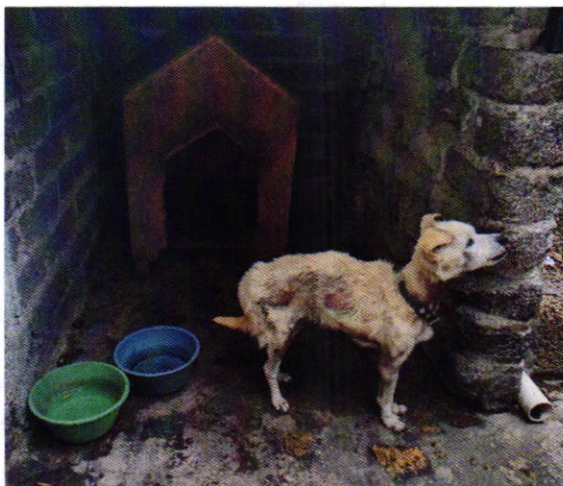
Figura 1. Ejemplar denunciado.

Derivado de lo observado por personal de esta Entidad, la persona responsable del ejemplar lo entregó de manera voluntaria al personal de esta Subprocuraduría, a efecto de que le sean brindados los cuidados de bienestar necesarios. Por lo cual la PAOT hizo entrega del perro a una persona adoptante, quien se comprometió a proporcionar las condiciones adecuadas de bienestar.