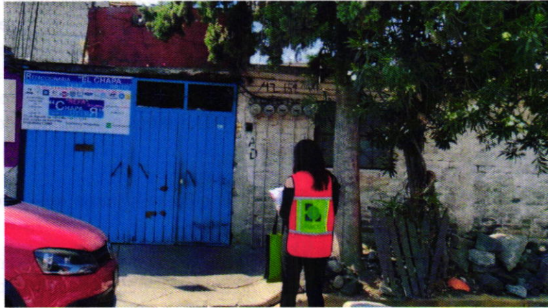
Figura 1. Vista del sitio referido en el escrito de denuncia.

En este sentido, de las constancias que obran en el presente expediente, se desprende que personal de esta Procuraduría llevó a cabo una visita de reconocimiento de hechos, de acuerdo a lo establecido en el artículo 15 BIS 4 fracción IV de la Ley Orgánica de esta Entidad, diligencia durante la cual desde el espacio público se constató la existencia de dos ejemplares caninos, los cuales empezaron a ladrar al percatarse de nuestra presencia; sin embargo, no fue posible ingresar al domicilio en cuestión, toda vez que la persona que atendió al personal de esta Entidad se negó a permitir el acceso al mismo.