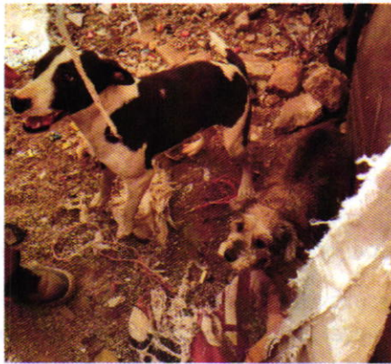
Figura 2. Vista de los ejemplares caninos motivo de denuncia.

Derivado de lo observado se realizaron las siguientes recomendaciones: