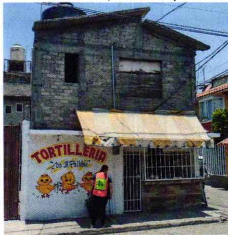
Figura 1. Vista del establecimiento mercantil motivo de denuncia.

En este sentido, de las constancias que obran en el presente expediente, se desprende que personal de esta Procuraduría llevó a cabo una visita de reconocimiento de hechos, de acuerdo a lo establecido en el artículo 15 BIS 4 fracción IV de la Ley Orgánica de esta Entidad, diligencia durante la cual el personal se constituyó sobre la vía pública, en específico, frente al establecimiento mercantil, con giro de tortillería denominado “Los 3 Pollitos”, siendo atendidos por la persona encargada de dicho lugar, a quien se le explicó el objeto, motivo y alcance de la diligencia, asimismo fue notificado el oficio PAOT-05-300/200-1746-2021; al respecto, manifestó que se encontraba en la mejor disposición de disminuir el volumen de la bocina utilizada para la reproducción de música grabada. Es de señalar que desde el espacio público no se constató la generación de emisiones sonoras que fueran susceptibles de medición acústica, toda vez que no se encontraba en funcionamiento.