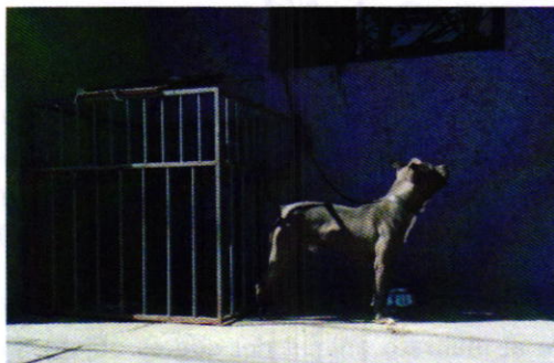
Figura 1. Vista del ejemplar canino motivo de denuncia.

Derivado de lo observado se realizaron las siguientes recomendaciones: