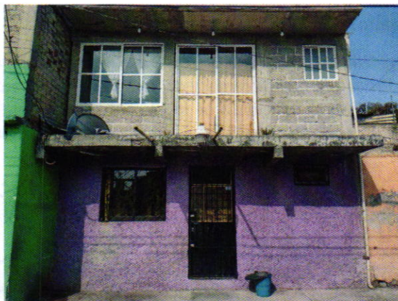
Figura 2. Evidencia de las adecuaciones

constatando que la persona encargada del cuidado del canino llevó a cabo la recomendación realizada por personal de esta Entidad.