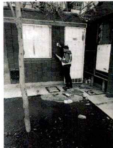
Fotografía 2.- Muestra la fachada del inmueble.

Es de resaltar que, en el Acuerdo de Admisión, que fue enviado por correo electrónico a la persona denunciante, se le hizo de conocimiento que contaba con un término de seis días hábiles para aportar las pruebas que estimara pertinentes en la investigación de los hechos, lo anterior conforme al artículo 90 del Reglamento de la Ley Orgánica de la Procuraduría Ambiental y del Ordenamiento Territorial de la Ciudad de México; sin embargo durante el procedimiento de investigación, no fueron proporcionados elementos de prueba que pudieran determinar incumplimiento a la normatividad en materia de bienestar animal.