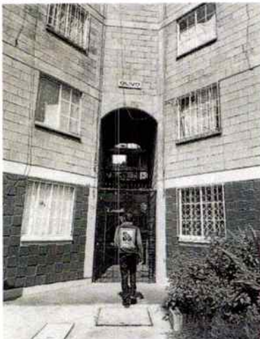
Fotografía 1.- Se observa el edificio Olivos.

En seguimiento a la denuncia, con el propósito de obtener mayor información, específicamente para identificar si loa hecho denunciados aún se presentaban, personal de esta Subprocuraduría, realizó 3 llamadas telefónicas al número proporcionado por la persona denunciante para oír y recibir notificaciones, de igual forma se le envió correo electrónico con el mismo fin, sin embargo dichos requerimientos no fueron atendidos.