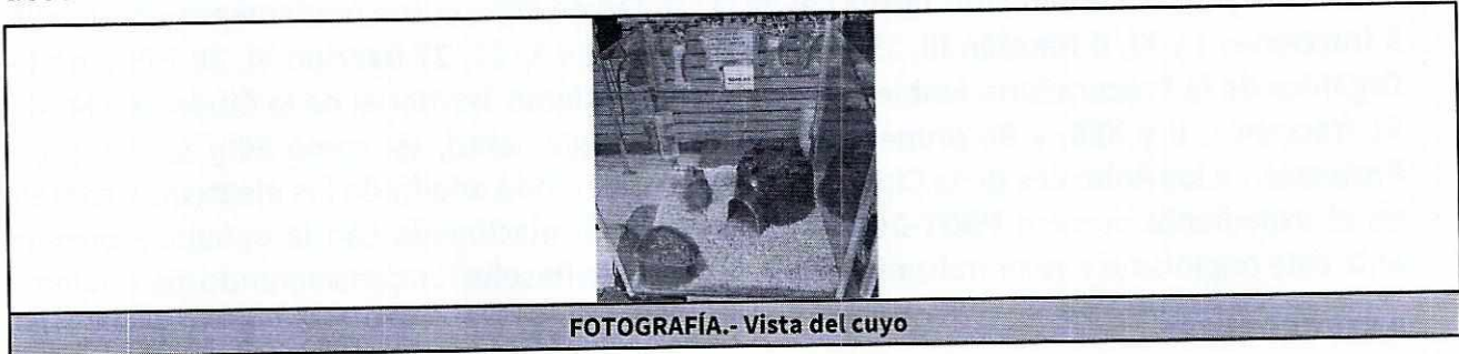
FOTOGRAFÍA.- Vista del cuyo

En este sentido, de las constancias que obran en el presente expediente, se desprende que personal de esta Subprocuraduría constató en el primer reconocimiento de hechos, que al interior del establecimiento denominado comercialmente como “+Kota”, se encontraban dos roedores de la especie Cava cobaya , mismos que deambulaban libremente en un espacio acorde a su tamaño; el sustrato se observó limpio, contaban con bebedero y alimento peletizado a libre acceso.