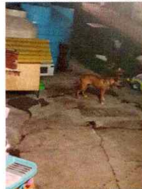
Fotografía 2. En la imagen se observa el canino y su casa para perro.