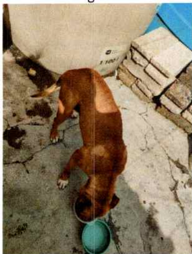
En la imagen se aprecia al canino comiendo.