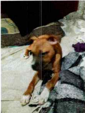
Fotografía 1. En la imagen se observa el canino

Por lo anterior, mediante aplicación móvil inteligente, donde envió evidencia de las condiciones de bienestar animal de su canino, el cual se aprecia que cuenta con las condiciones de bienestar animal necesarias.