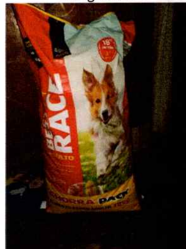
En la imagen se aprecia el bulto de croquetas que se le proporciona.