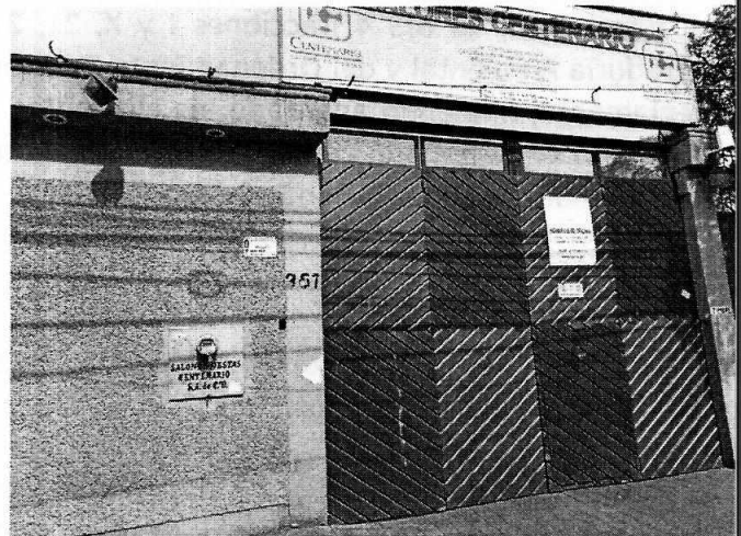
Fotografía 1. Fachada del sitio señalado como el lugar de los hechos.

En ese sentido, personal de esta Subprocuraduría realizó una visita de reconocimientos de hechos de acuerdo a lo establecido en el artículo 15 BIS 4 fracción IV de la Ley Orgánica de esta Entidad, en el cual se constató un salón de fiestas denominado “Salón de Fiestas Centenario” por así exhibirlo en su anuncio denominativo, ubicado en Avenida Centenario número 367, colonia Nextengo, Alcaldía Azcapotzalco; por lo anterior, se realizó una consulta en el Sistema de Información Geográfica de la Secretaría de Desarrollo Urbano y Vivienda de la Ciudad de México (SIG-SEDUVI/CDMX), de la cual se desprende que conforme al Programa Delegacional de Desarrollo Urbano vigente para la Alcaldía Azcapotzalco, al predio ubicado en Avenida Centenario número 367, colonia Nextengo, Alcaldía Azcapotzalco, le aplica la zonificación H/3/30 (Habitacional, 3 niveles máximos de altura, 30% mínimo de área libre) en el cual el uso de suelo para salones de fiestas infantiles y salones para banquetes y fiestas se encuentra prohibido.