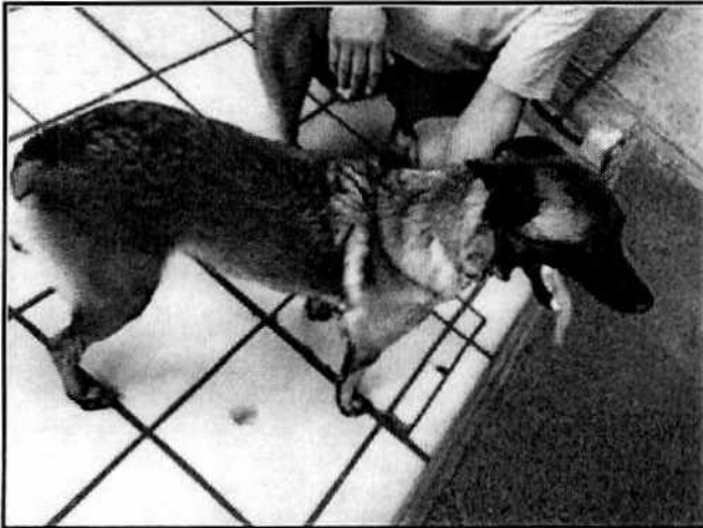
Imagen. Ejemplar canino de nombre "Foxy".

Expediente: PAOT-2019-1926-SPA-1107 No. Folio: PAOT-05-300/200- 14793 -2019