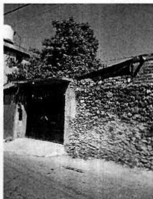
Fotografía 1. Vista del inmueble señalado por la persona denunciante.

En este sentido, personal de esta Subprocuraduría realizó cuatro visitas de reconocimiento de hechos de acuerdo a lo establecido en el artículo 15 BIS 4 fracción IV de la Ley Orgánica de esta Entidad, diligencias durante la cual, desde la vía pública, no se constató la presencia de ejemplares caninos al interior del predio siendo que en ninguna ocasión se encontró a algún habitante del inmueble, por lo que se procedió a notificar el citatorio correspondiente, no obstante dicho requerimiento no fue atendido.