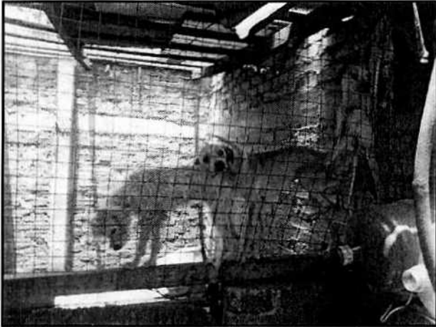
Imagen. Ejemplares caninos.

Al respecto, en seguimiento a la investigación, personal adscrito a esta Subprocuraduría realizó una nueva visita de reconocimiento de hechos, durante la cual se constató que el ejemplar canino criollo blanco con negro se le había extendido la cadena, la cual media aproximadamente 2.5 metros, no obstante se le recomendó que se le realizaran paseos diarios, en el mismo acto se observó una casa la cual presentaba un colchón para perro en su interior; por otro lado los ejemplares caninos de color café claro habían ganado peso, sin embargo su sitio de alojamiento continuaba sucio, por lo cual se le exhortó a que limpiara el lugar.