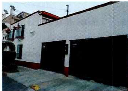
Imagen del sitio motivo de la denuncia

En seguimiento; mediante una llamada telefónica la persona denunciante informó a personal de esta Subprocuraduría que los ejemplares caninos que motivó la denuncia ya no habitan en el lugar, por lo que los hechos dejaron de existir.