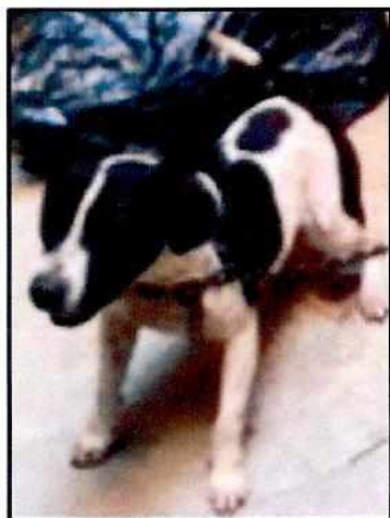
Imagen 1. Ejemplar canino motivo de denuncia.