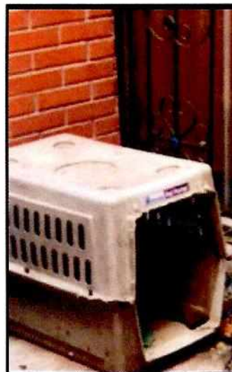
Imagen 2. Sitio de alojamiento y recipiente de comida.

Es de resaltar que, en el Acuerdo de Admisión, que fue enviado por correo electrónico a la persona denunciante, se le hizo de conocimiento que contaba con un término de seis días hábiles para aportar las pruebas que estimara pertinentes en la investigación de los hechos, lo anterior conforme al artículo 90 del Reglamento de la Ley Orgánica de la Procuraduría Ambiental y del Ordenamiento Territorial de la Ciudad de México; sin embargo durante el procedimiento de investigación, no fueron proporcionados elementos de prueba que pudieran determinar incumplimiento a la normatividad en materia de bienestar animal.