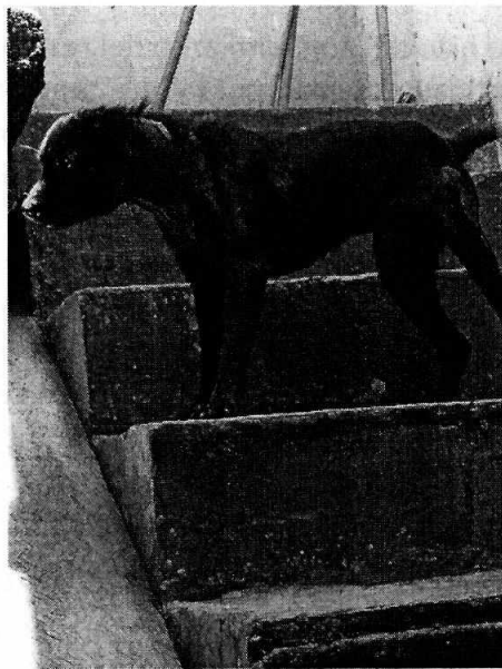
Fotografías 1 y 2. Caninos motivo de denuncia.