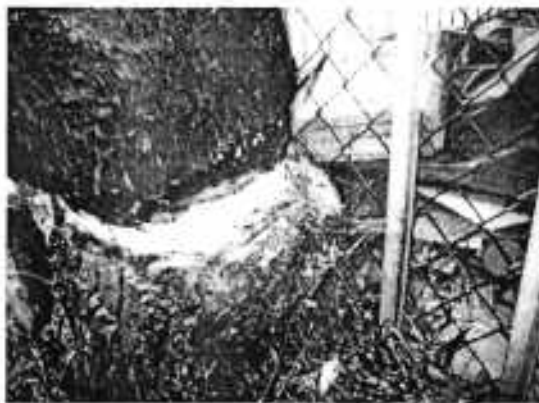
Fotografía 1. Vista del árbol motivo de denuncia.

En este sentido, personal de esta Subprocuraduría realizó visita reconocimientos de hechos de acuerdo a lo establecido en el artículo 15 BIS 4 fracción IV de la Ley Orgánica de esta Entidad, diligencia durante la cual se constató que, en el sitio motivo de denuncia se yergue un individuo arbóreo de la especie comúnmente conocida como jacaranda, de aproximadamente 7 metros de altura, la cual presenta estructura susceptible a mejora y condición general declinante incipiente, que en la base del fuste presenta daño mecánico, aparentemente generado por vandalismo, pero que no pone en riesgo su supervivencia.