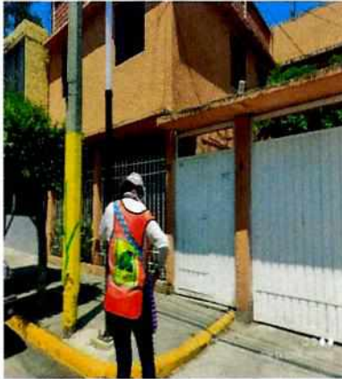
Figura 1. Lugar de los hechos denunciados.