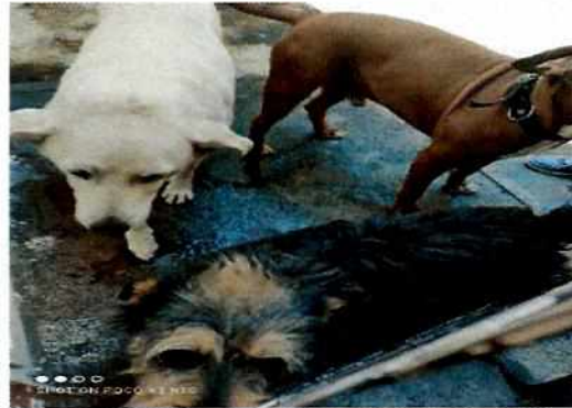
Figura 2. Ejemplares denunciados.

Es de resaltar que, en el Acuerdo de Admisión, que fue enviado por correo electrónico a la persona denunciante, se le hizo de conocimiento que contaba con un término de seis días hábiles para aportar las pruebas que estimara pertinentes en la investigación de los hechos, lo anterior conforme al artículo 90 del Reglamento de la Ley Orgánica de la Procuraduría Ambiental y del Ordenamiento Territorial de la Ciudad de México; sin embargo durante el procedimiento de investigación, no fueron proporcionados elementos de prueba que pudieran determinar incumplimiento a la normatividad en materia de bienestar animal.