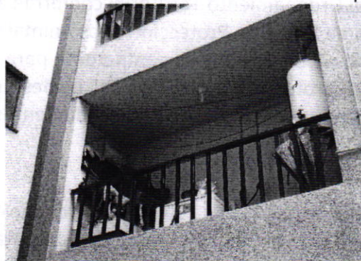
Fotografía 2. Vista del sitio en el cual presuntamente se encontraba el ejemplar canino motivo de denuncia.

En este sentido, personal de esta Subprocuraduría realizó tres reconocimientos de hechos de acuerdo a lo establecido en el artículo 15 BIS 4 fracción IV de la Ley Orgánica de esta Entidad, durante los cuales no fue posible ingresar al domicilio antes referido; no obstante, en el pasillo del departamento en cuestión, no se constató la existencia de algún ejemplar canino, ladridos provenientes del interior del inmueble u olores característicos de la presencia de dicho animal.