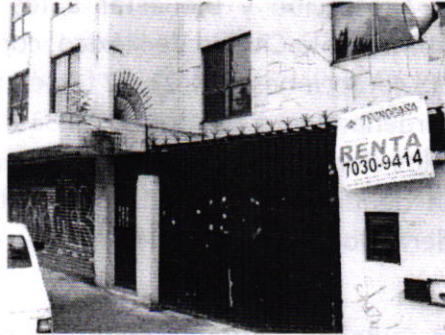
Fotografía 1. Vista del inmueble referido en el escrito de denuncia.

En este sentido, personal de esta Subprocuraduría realizó visita de reconocimiento de hechos de acuerdo a lo establecido en el artículo 15 BIS 4 fracción IV de la Ley Orgánica de esta Entidad, durante la cual no se constataron los hechos motivo de denuncia, toda vez que una persona habitante del inmueble de referencia informó que dicho sitio se conforma por 5 edificios (A, B, C, D y E) y cada uno de éstos cuenta con un departamento número 102; sin embargo, en el escrito de denuncia no fue señalado el edificio en el que se encontraba el ejemplar canino en cuestión.