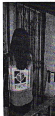
Figuras 1 y 2. Vista del inmueble referido en el escrito de denuncia.

En seguimiento a la denuncia, personal adscrito a esta Subprocuraduría realizó una segunda visita de reconocimiento de hechos, diligencia durante la cual no se constató la existencia de ejemplares caninos, ladridos provenientes del interior de la vivienda en comento u olores característicos de su presencia; no obstante, desde el área común del edificio en cuestión, se escucharon los cacareros de diversas aves (gallos); sin embargo, no fue posible encontrar a la persona propietaria de los animales de compañía; al respecto, por lo que se fijó en la puerta del sitio de referencia el citatorio correspondiente, a fin de que la persona responsable de los animales manifestase lo que a su derecho conviniera, no obstante, dicho requerimiento no fue atendido.