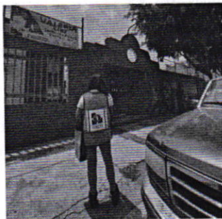
Figura 3. Vista del inmueble referido en el escrito de denuncia.

En seguimiento a la denuncia, personal adscrito a esta Subprocuraduría realizó una segunda visita de reconocimiento de hechos, diligencia durante la cual no se constató la existencia de ejemplares caninos, ladridos provenientes del interior de la vivienda en comento u olores característicos de su presencia; no obstante, desde el área común del edificio en cuestión, se escucharon los cacareros de diversas aves (gallos); sin embargo, no fue posible encontrar a la persona propietaria de los animales de compañía; al respecto, por lo que se fijó en la puerta del sitio de referencia el citatorio correspondiente, a fin de que la persona responsable de los animales manifestase lo que a su derecho conviniera, no obstante, dicho requerimiento no fue atendido.