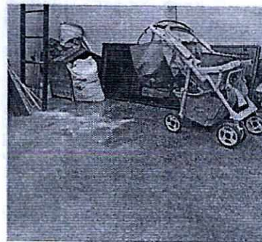
Imagen 2. Patio del inmueble ubicado en el tercer nivel.