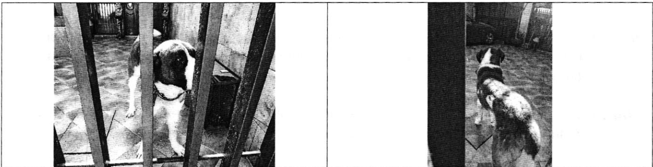
Fotografías 1 y 2. Vista del ejemplar canino motivo de denuncia.

Es importante mencionar que durante la diligencia el ejemplar canino contaba con un sitio de resguardo que lo protege de la intemperie, presentaba un comportamiento sociable y responsivo, es alimentado con croquetas y cuenta con su recipiente de agua.