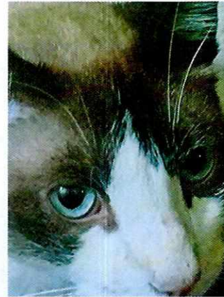
Fotografía 14. Ejemplar felino "Moni".