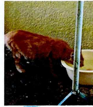
Fotografía 3. Ejemplar felino "Nene".