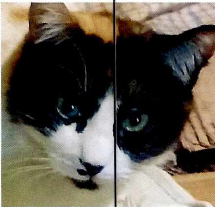
Fotografía 10. Ejemplar felino "Mao".