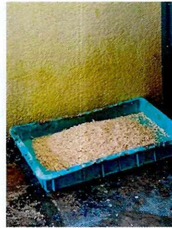
Fotografía 16. Arenero.

Es de resaltar que, en el Acuerdo de Admisión, que fue enviado por correo electrónico a la persona denunciante, se le hizo de conocimiento que contaba con un término de seis días hábiles para aportar la pruebas que estimara pertinentes en la investigación de los hechos, lo anterior conforme al artículo 90 de Reglamento de la Ley Orgánica de la Procuraduría Ambiental y del Ordenamiento Territorial de la Ciudad de México; sin embargo durante el procedimiento de investigación, no fueron proporcionados elementos de prueba que pudieran determinar incumplimiento a la normatividad en materia de bienestar animal.