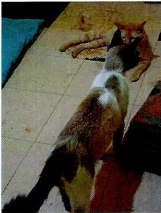
Fotografía 13. Ejemplar felino "Carla".