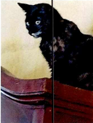
Fotografía 7. Ejemplar felino "Beki".