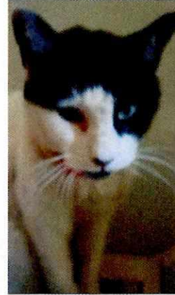
Fotografía 9. Ejemplar felino "Mario".