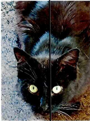
Fotografía 4. Ejemplar felino "Deisy".