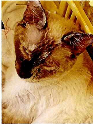
Fotografía 5. Ejemplar felino "Pecosa".