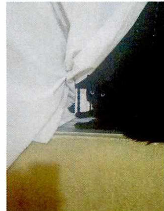
Fotografía 12. Ejemplar felino "Nene".

PROCURADURÍA AMBIENTAL Y DE ORDENAMIENTO TERRITORIAL DE LA CDMX