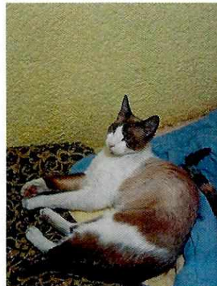
Fotografía 11. Ejemplar felino "Carla".