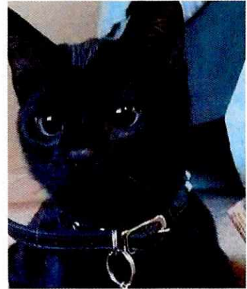
Fotografía 6. Ejemplar felino "Negrito".