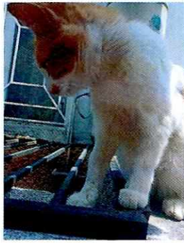
Fotografía 2. Ejemplar felino "Caballito".