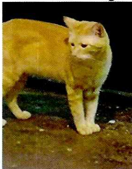
Fotografía 1. Ejemplar felino "Leonardo".