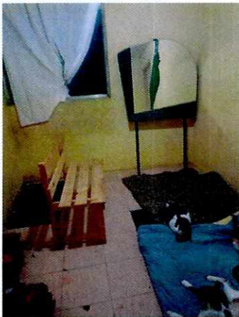
Fotografía 15. Sitio de alojamiento..