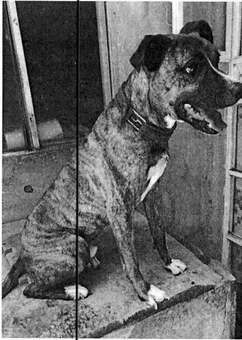
Imagen 1. Ejemplar canino "Jacob"

durante el procedimiento de investigación, no fueron proporcionados elementos de prueba que pudieran determinar incumplimiento a la normatividad en materia de bienestar animal.