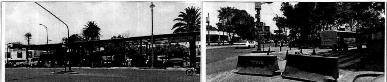
Se muestra el "CETRAM Dr. Gálvez"

Personal de esta Subprocuraduría realizó visita de reconocimiento de hechos de acuerdo a lo establecido en el artículo 15 BIS 4 fracción IV de la Ley Orgánica de esta Entidad, en el cual se observó un espacio en el cual convergen diferentes rutas de transporte público colectivo separados por andenes, los cuales ingresan por la avenida Insurgentes para dar servicio a los usuarios para posteriormente salir por la Avenida Revolución, en la diligencia no se constataron trabajos de construcción o remodelación en el sitio.