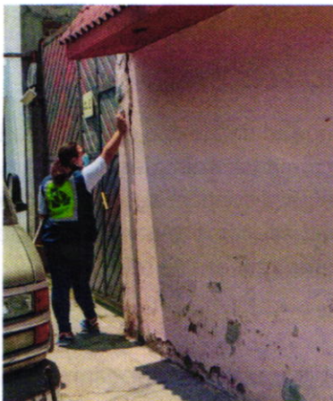
Fotografía 1. Fachada del sitio referido en la denuncia.