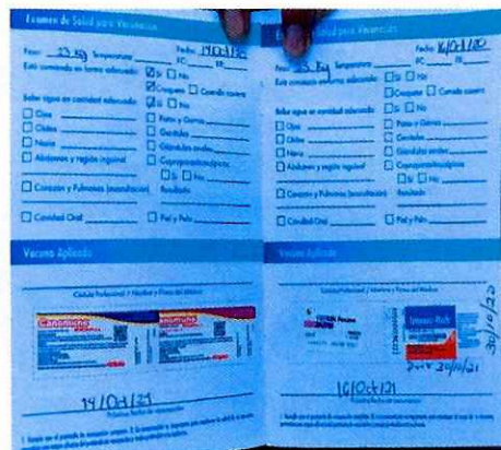
Imagen 3. Cartilla de vacunación vigente

Es de resaltar que, en el Acuerdo de Admisión, que fue enviado por correo electrónico a la persona denunciante, se le hizo de conocimiento que contaba con un término de seis días hábiles para aportar las pruebas que estimara pertinentes en la investigación de los hechos, lo anterior conforme al artículo 90 del Reglamento de la Ley Orgánica de la Procuraduría Ambiental y del Ordenamiento Territorial de la Ciudad de México; sin embargo durante el procedimiento de investigación, no fueron proporcionados elementos de prueba que pudieran determinar incumplimiento a la normatividad en materia de bienestar animal.