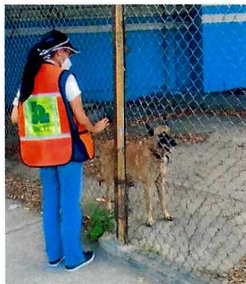
Imagen 1. Canino hembra llamado Samanta"