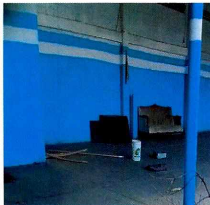
Imagen 2. Lugar de alojamiento dentro del inmueble, se observa sus tazones de comida y agua, así como su refugio de madera y sillón para echarse