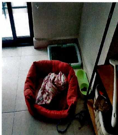
Imagen 2. Lugar de alojamiento dentro del inmueble, se observa sus tazones de comida y agua, así como tapete para realizar sus necesidades fisiológicas