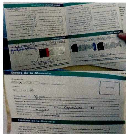
Imagen 3. Cartilla de vacunación vigente

Es de resaltar que, en el Acuerdo de Admisión, que fue enviado por correo electrónico a la persona denunciante, se le hizo de conocimiento que contaba con un término de seis días hábiles para aportar las pruebas que estimara pertinentes en la investigación de los hechos, lo anterior conforme al artículo 90 del Reglamento de la Ley Orgánica de la Procuraduría Ambiental y del Ordenamiento Territorial de la Ciudad de México; sin embargo durante el procedimiento de investigación, no fueron proporcionados elementos de prueba que pudieran determinar incumplimiento a la normatividad en materia de bienestar animal.