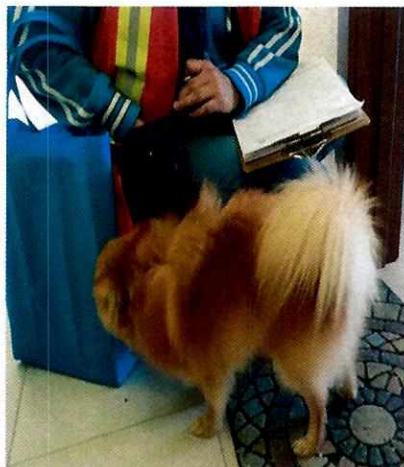
Imagen 1. Canino macho llamado "Rex"