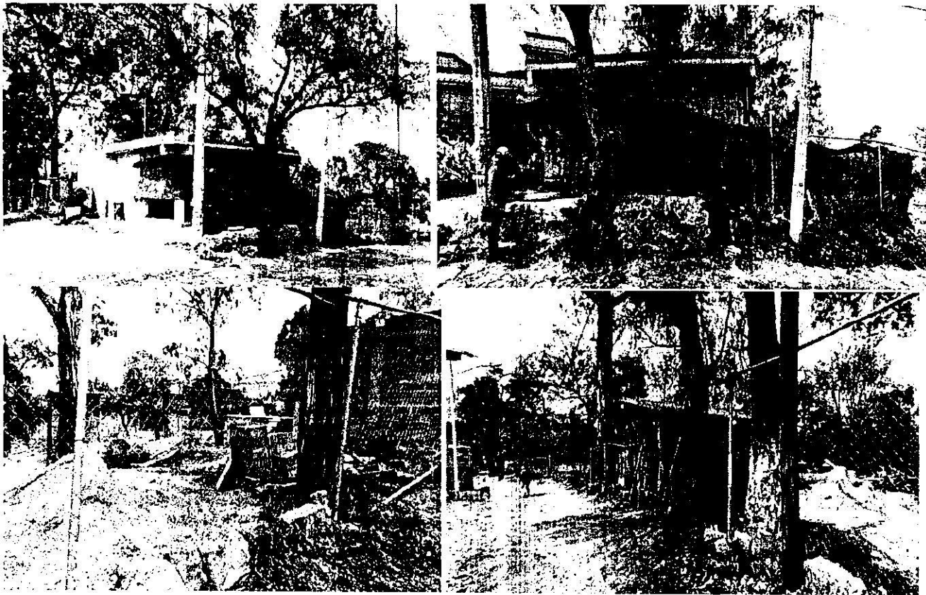
Imagen 1, 2, 3 y 4. Localización y registro fotográfico de visita de reconocimiento de hechos en el predio objeto de denuncia.

Santiago número 85, Colonia Tlaxopa Norte, Alcaldía Xochimilco, con la finalidad de realizar el reconocimiento de los hechos denunciados, diligencia de la cual se levantó el acta circunstanciada correspondiente en la que se hizo constar que se observan dos cuerpos constructivos, al frente se ubica el primer volumen en obra negra de un nivel de altura, mientras que al fondo se ubica un segundo volumen de un nivel de altura a base de muros de madera y cubierta de teja. Asimismo, durante la diligencia se observan materiales de construcción al interior del predio, así como merma y cascajo proveniente de la construcción. Cabe señalar, que no se constató derribo de arbolado durante la diligencia, como se muestra a continuación: (Ver Imagen 1, 2, 3 y 4). -----