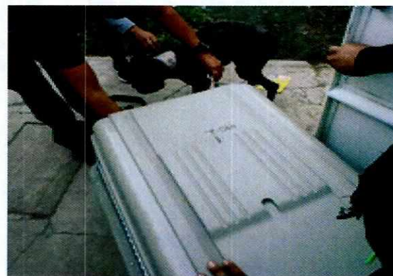
Imagen 2. Personal de esta Entidad realizando la evaluación del canino