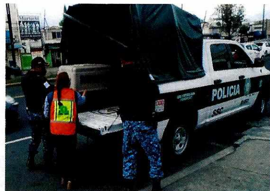
Imagen 3 y 4. En conjunto esta Entidad con el personal de Brigada de Vigilancia Animal de SSC, resguardando al ejemplar canino

En virtud de lo antes expuesto, esta Entidad considera procedente emitir la presente resolución, de conformidad con el artículo 27 fracción VII de la Ley Orgánica de esta Procuraduría, por cumplimiento voluntario.