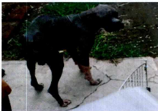
Imagen 1. Canino criollo llamado "Ringo"