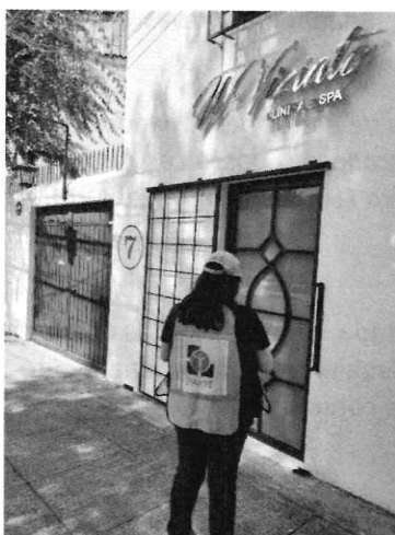
Imagen 1. Fachada del inmueble objeto de denuncia

En este sentido, de las constancias que obran en el presente expediente, se desprende que de conformidad con el Programa Delegacional de Desarrollo Urbano vigente para la Alcaldía Benito Juárez, al predio en cuestión le aplicaba una zonificación HM (Habitacional Mixto), siendo que el uso de suelo para pensión canina no se encontraba previsto. Por lo anterior personal de esta Subprocuraduría llevó a cabo una visita de reconocimiento de hechos, de acuerdo a lo establecido en el artículo 15 BIS 4 fracción IV de la Ley Orgánica de esta Entidad, diligencia durante la cual se constató que el establecimiento mercantil motivo de denuncia ya no se encontraba en funcionamiento.