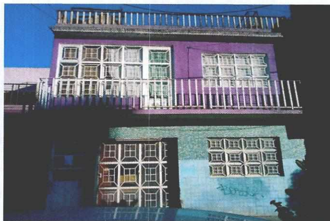
Imagen 2. Sitio de denuncia

Es de resaltar que, en el Acuerdo de Admisión, que fue enviado por correo electrónico a la persona denunciante, se le hizo de conocimiento que contaba con un término de seis días hábiles para aportar las