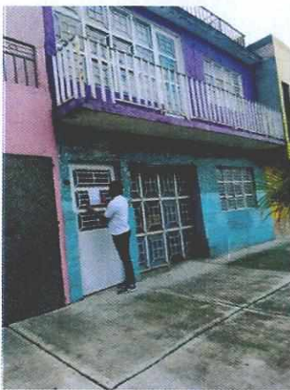
Imagen 1. Sitio de la denuncia

En este sentido, personal de esta Subprocuraduría realizó cuatro visitas de reconocimientos de hechos de acuerdo a lo establecido en el artículo 15 BIS 4 fracción IV de la Ley Orgánica de esta Entidad, diligencias en las que personal adscrito a esta Procuraduría se constituyó frente al inmueble ubicado en calle Radamés Gaxiola Andrade número 811, colonia Escuadrón 201, Alcaldía Iztapalapa, en el acto se procedió a tocar a la puerta en reiteradas ocasiones esperando ser atendidos por el propietario y/o habitante del inmueble; sin embargo solo fue en nuestra tercer visita que una persona de sexo femenino se asomó por la ventana, aludiendo ser únicamente una visita, por lo cual no nos fue recibido la cédula de notificación. En las 4 visitas, se dejaron los oficios pegados en la puerta del inmueble. Respecto a los hechos denunciados cabe mencionar que no se escucharon ladridos, ni se percibieron olores que pudieran indicar la existencia de algún ejemplar canino.