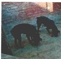
"Jeico" y "Goruca"