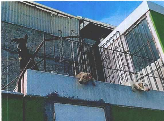
Imagen 1. Ejemplares caninos motivo de la denuncia.

En este sentido, personal de esta Subprocuraduría realizó un reconocimiento de hechos de acuerdo a lo establecido en el artículo 15 BIS 4 fracción IV de la Ley Orgánica de esta Entidad, en el cual se constató la existencia de tres ejemplares caninos, hembras, de raza mestiza, una de color negro de 2 años que responde al nombre de "Negra", otra de color blanco de 1 año de edad que responde al nombre de "Frida" y otra de color café de 1 año de edad que responde al nombre de "Canela"; todas de talla mediana, las cuales permanecían en la azotea, contando con un cuarto para su resguardo por las noches y días calurosos o con lluvia, se identificó un recipiente de agua limpia y otros recipientes de alimento (uno para cada una), se les alimenta una vez al día con comida casera, las dos ejemplares más jóvenes presentaban una condición corporal baja (2/5) y la mayor de edad presentaba una condición corporal ideal (3/5), su comportamiento era responsivo, sin manifestar estrés.