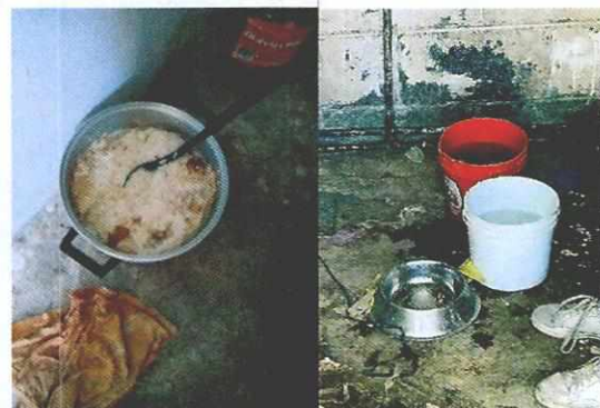
Imagen 3. Alimento recién preparado y recipientes para agua.

La propietaria de los ejemplares caninos motivo de la denuncia, manifestó que daría en adopción a las dos hembras más jóvenes, ya que pronto le harían una cirugía y se cambiaría de domicilio.