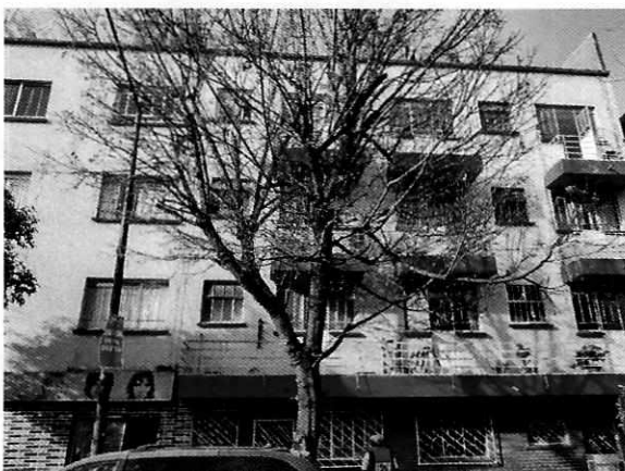
Figuras 1-2. Lugar de los hechos denunciados.

En seguimiento de lo anterior, personal de esta Subprocuraduría informó a la persona denunciante que durante visita de reconocimiento de hechos no se constató la presencia del ejemplar canino en el sitio señalado en su denuncia, por lo que los hechos que motivaron su denuncia dejaron de existir.