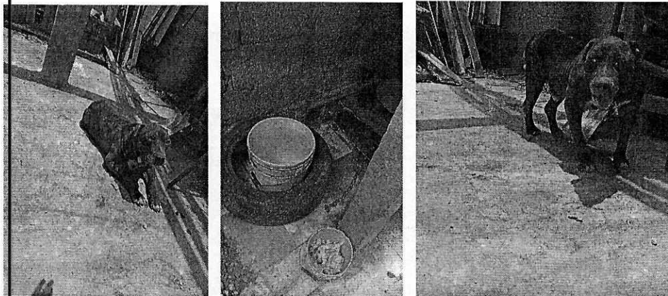
Figuras 3-4. Se observa al ejemplar canino libre, sin lesiones, lugar de alojamiento limpio y sus recipientes con alimento y agua.

En seguimiento de lo anterior, la persona propietaria del canino envió evidencia fotográfica del ejemplar, en la cual se muestra que se llevaron a cabo las recomendaciones realizadas por personal de esta Entidad.