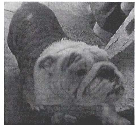
Imágenes 1 a 6. Muestran los ejemplares motivo de denuncia

Asimismo, en el Acuerdo de Admisión PAOT-05-300/200-3010-2020, que fue enviado por correo electrónico a la persona denunciante con fecha 4 de marzo de 2020, se le hizo de conocimiento que contaba con un término de seis días hábiles para aportar las pruebas que estimara pertinentes en la investigación de los hechos, lo anterior conforme al artículo 90 del Reglamento de la Ley Orgánica de la Procuraduría Ambiental y del Ordenamiento Territorial de la Ciudad de México; sin embargo durante el procedimiento de investigación, no fueron proporcionados elementos de prueba que pudieran determinar incumplimiento a la normatividad en materia de bienestar animal.