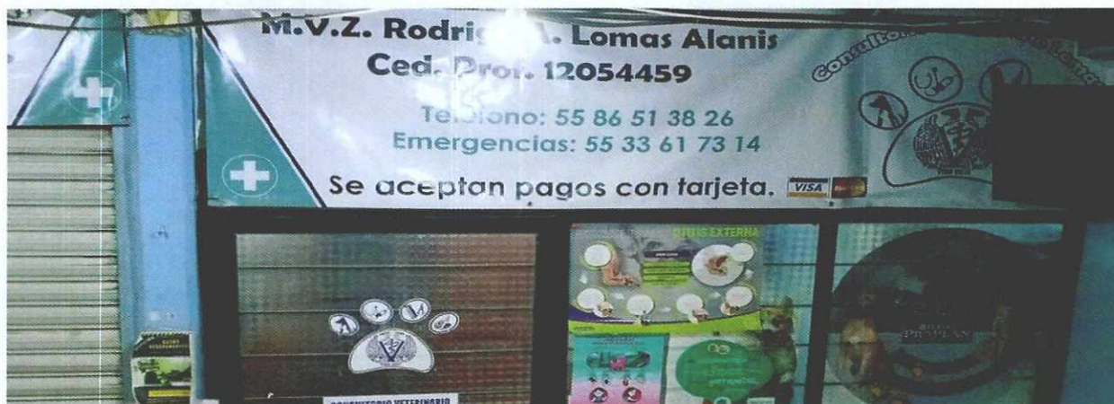
Figura 1. Lugar de los hechos denunciados.

En este sentido, de las constancias que obran en el presente expediente, se desprende que personal de esta Subprocuraduría llevó a cabo una visita de reconocimiento de hechos, de acuerdo a lo establecido en el artículo 15 BIS 4 fracción IV de la Ley Orgánica de esta Entidad, diligencia durante la cual no se encontró el local anteriormente mencionado, en su lugar esta otro establecimiento con giro comercial diferente (cerrajería) una persona locataria del lugar hizo de conocimiento al personal adscrito a esta Subprocuraduría que el acuario que fueron señalados en el escrito de la denuncia, había cerrado aproximadamente dos meses atrás. Cabe señalar que el personal de la PAOT constató que efectivamente no había algún local con ejemplares con las características descritas en la denuncia al interior del domicilio en cuestión.