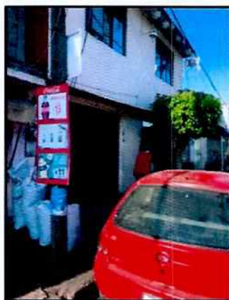
Imagen 1. Fachada del inmueble motivo de denuncia.

Posteriormente, se mantuvo comunicación vía telefónica con la persona denunciante, quien indicó que ya no vive en el lugar y que por esta situación dejó de observar los hechos denunciados, en el mismo acto refiere que desea el desistimiento de la denuncia.