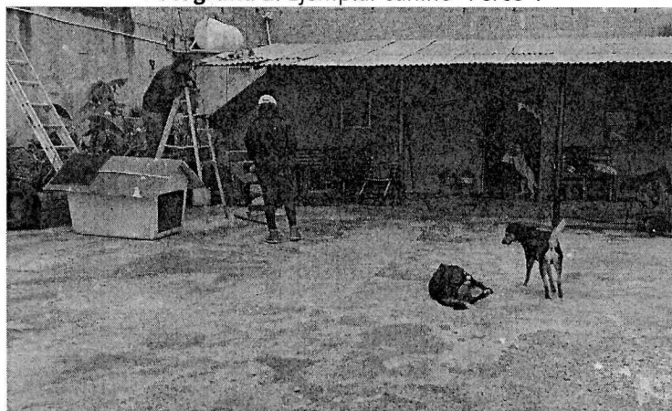
Fotografía 4. Sitio de alojamiento.

Es de resaltar que, en el Acuerdo de Admisión, que fue enviado por correo electrónico a la persona denunciante, se le hizo de conocimiento que contaba con un término de seis días hábiles para aportar las pruebas que estimara pertinentes en la investigación de los hechos, lo anterior conforme al artículo 90 del Reglamento de la Ley Orgánica de la Procuraduría Ambiental y del Ordenamiento Territorial de la Ciudad de México; sin embargo durante el procedimiento de investigación, no fueron proporcionados elementos de prueba que pudieran determinar incumplimiento a la normatividad en materia de bienestar animal.