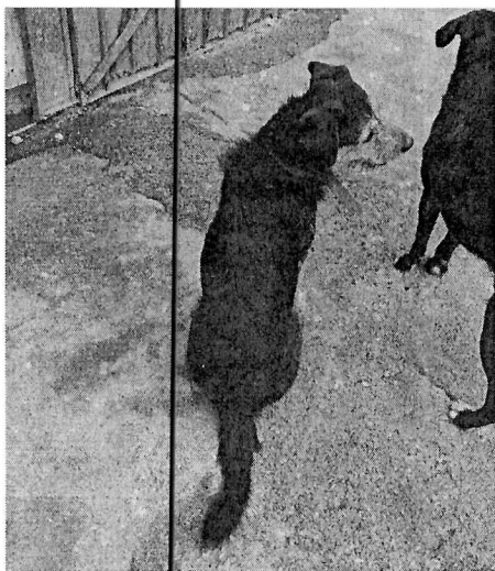
Fotografía 1. Ejemplar canino "Meco".