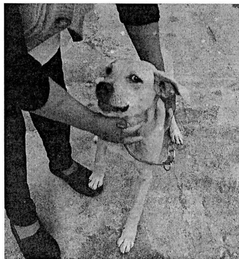
Fotografía 2. Ejemplar canino "Ferro".