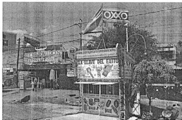
Abril de 2022

Ahora bien, de conformidad con lo previsto en el artículo 88 bis fracción I de la Ley Ambiental de Protección a la Tierra para la Ciudad de México, en los parques y jardines, plazas ajardinadas o arboladas, zonas con cualquier cubierta vegetal en la vía pública , alamedas y arboladas, jardineras , barrancas, áreas de valor ambiental y áreas naturales protegidas, queda prohibida la construcción de cualesquier obra . -----