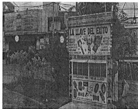
Octubre de 2021