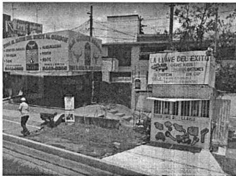
Julio de 2009

autoridad y las que sean contrarias a la moral, al derecho o las buenas costumbres; realizó la búsqueda del sitio denunciado en el Street View en la herramienta Google Maps, e identificó un historial de imágenes a pie de calle del sitio denunciado, observando que desde julio de 2009 y hasta abril de 2022, el área denunciada estaba ajardinada y contaba con diversos individuos arbóreos jóvenes ( ficus benjamina ), como a continuación se observa: -----