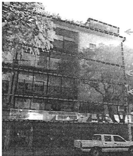
Imagen de mes Noviembre de 2021