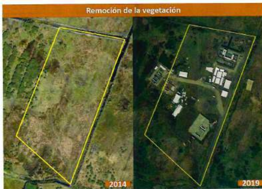
Figura 3. Vista aérea de la zona en donde se observa la remoción de vegetación.

Debe considerarse que la vegetación ruderal y herbácea del sitio donde se removió vegetación para el emplazamiento de las estructuras de escenografía, servicios, taller y vigilancia de la producción, reviste una gran importancia para el ANP. De acuerdo con el estudio realizado por esta Procuraduría, el tipo de suelo predominante en el sitio es un Feozem, suelo para el que la FAO recomienda procurar la presencia de vegetación permanente, ya que la capacidad de resistir la erosión hídrica y eólica de este tipo de suelo, depende entre otros factores, de la extensión de superficie ocupada por vegetación.