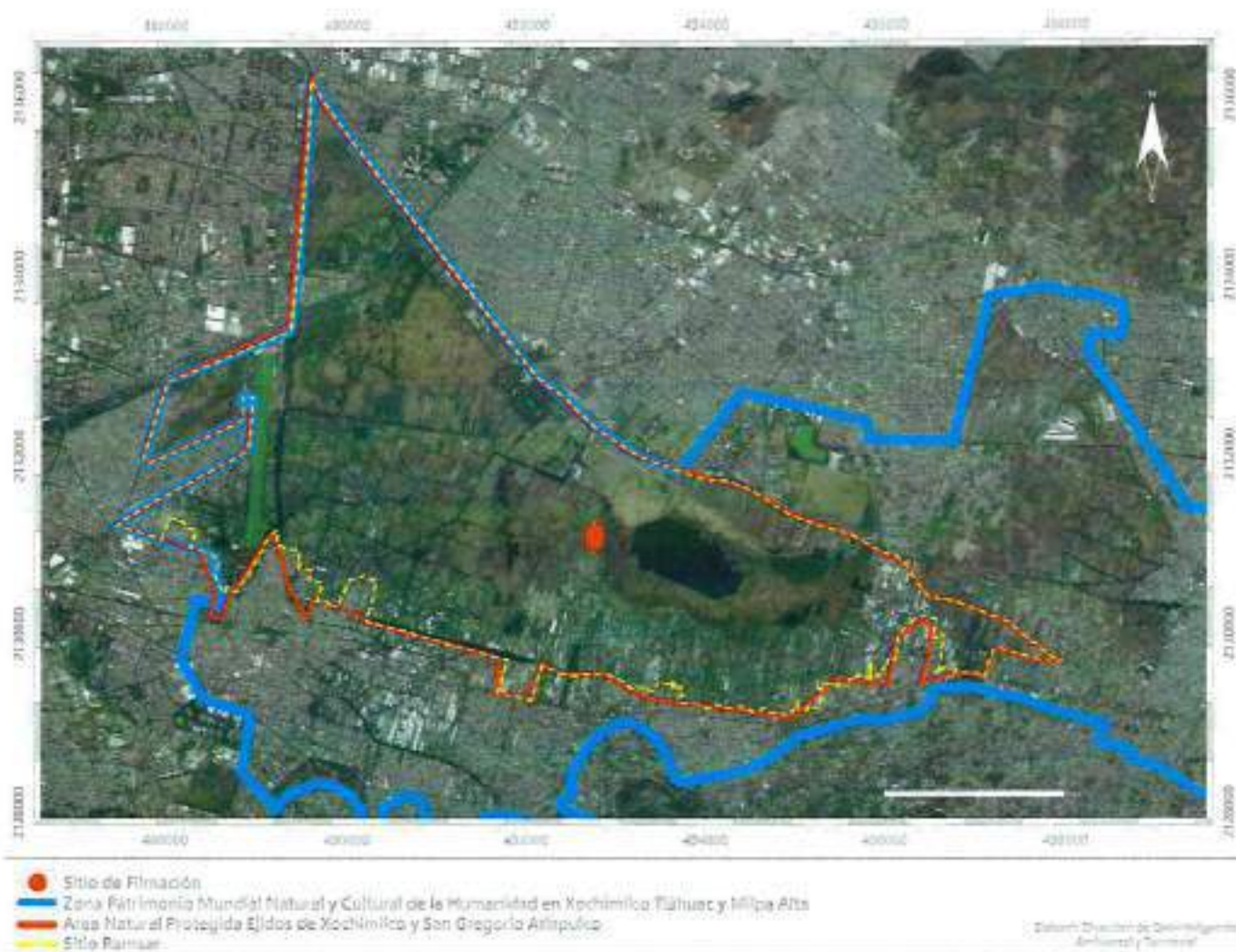
Figura 1. Plano en donde se define el polígono de la ANP y de las categorías con las cuales ha sido reconocido. Fuente. PAOT, 2019.

No. de Folio: PAOT-05-300/200-12916-2019